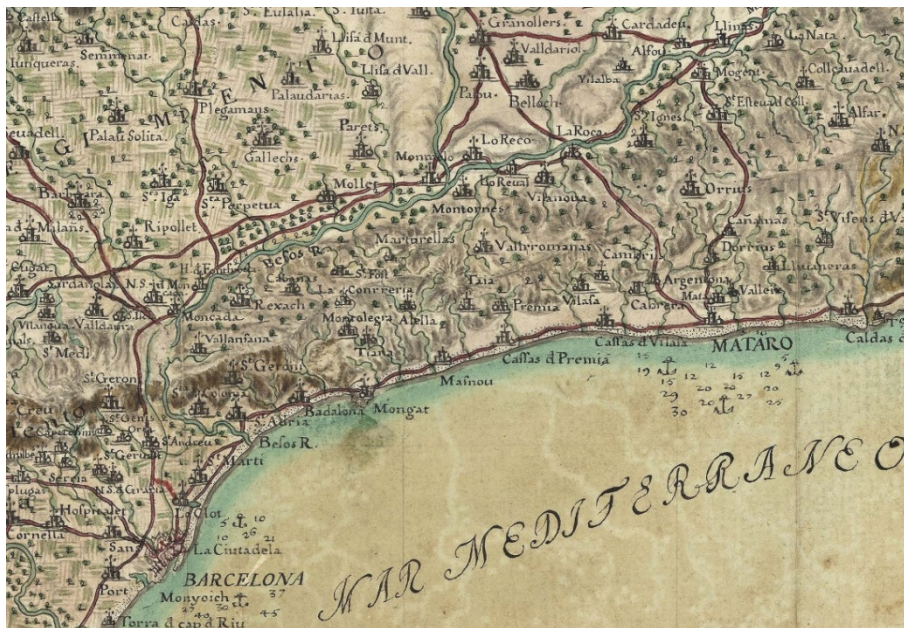
Fragment del Mapa del Corregiment de Mataró (any 1726), obra d'Oleguer de Taverner i d'Ardena (? , 1676 - Barcelona, 1727)

Us convidem a participar en les activitats